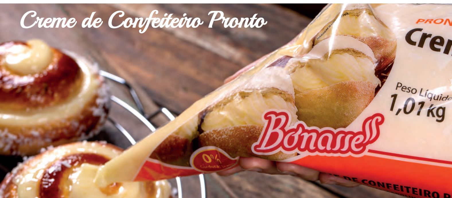
Creme de Confeiteiro Pronto