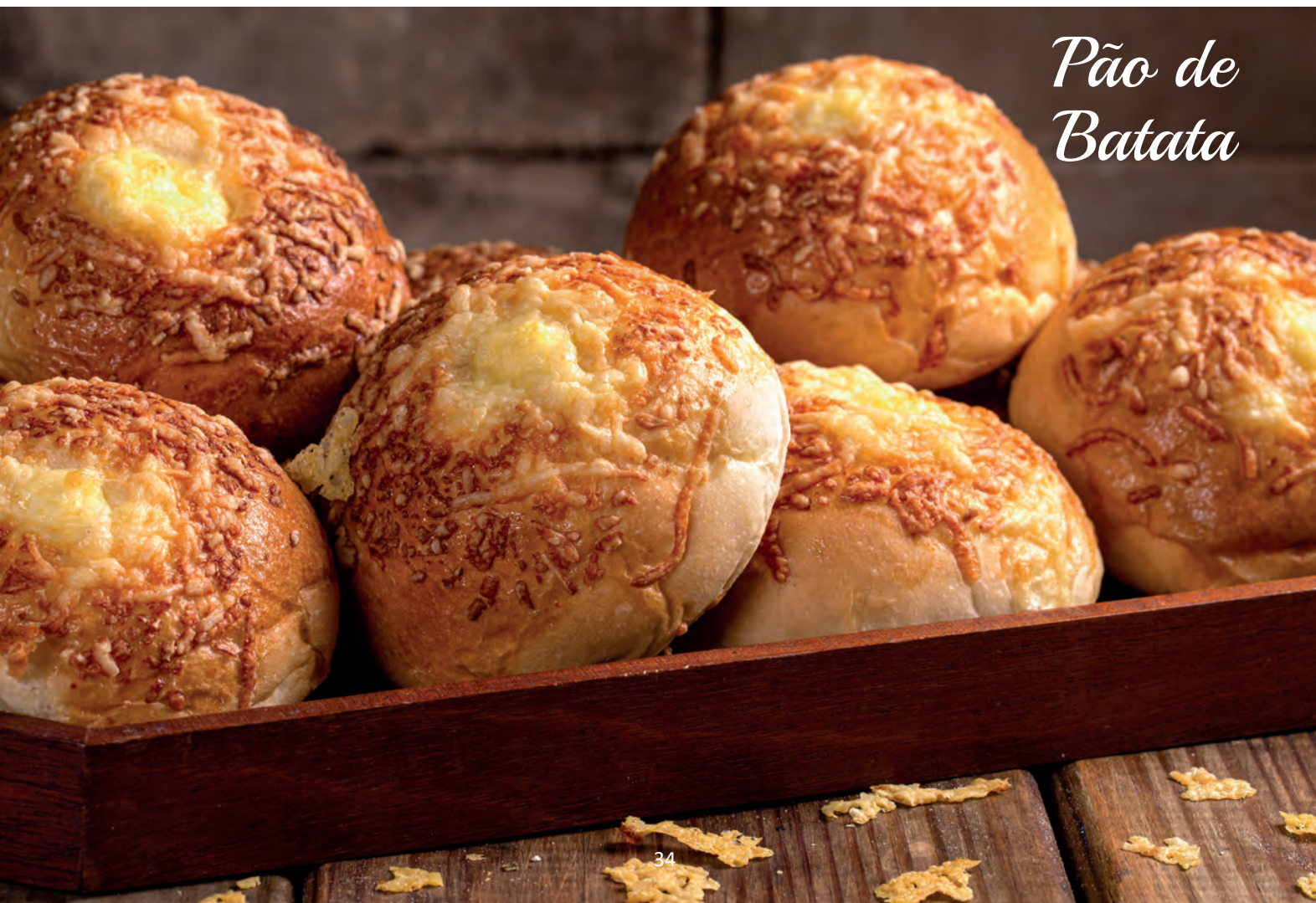
Pão de Batata