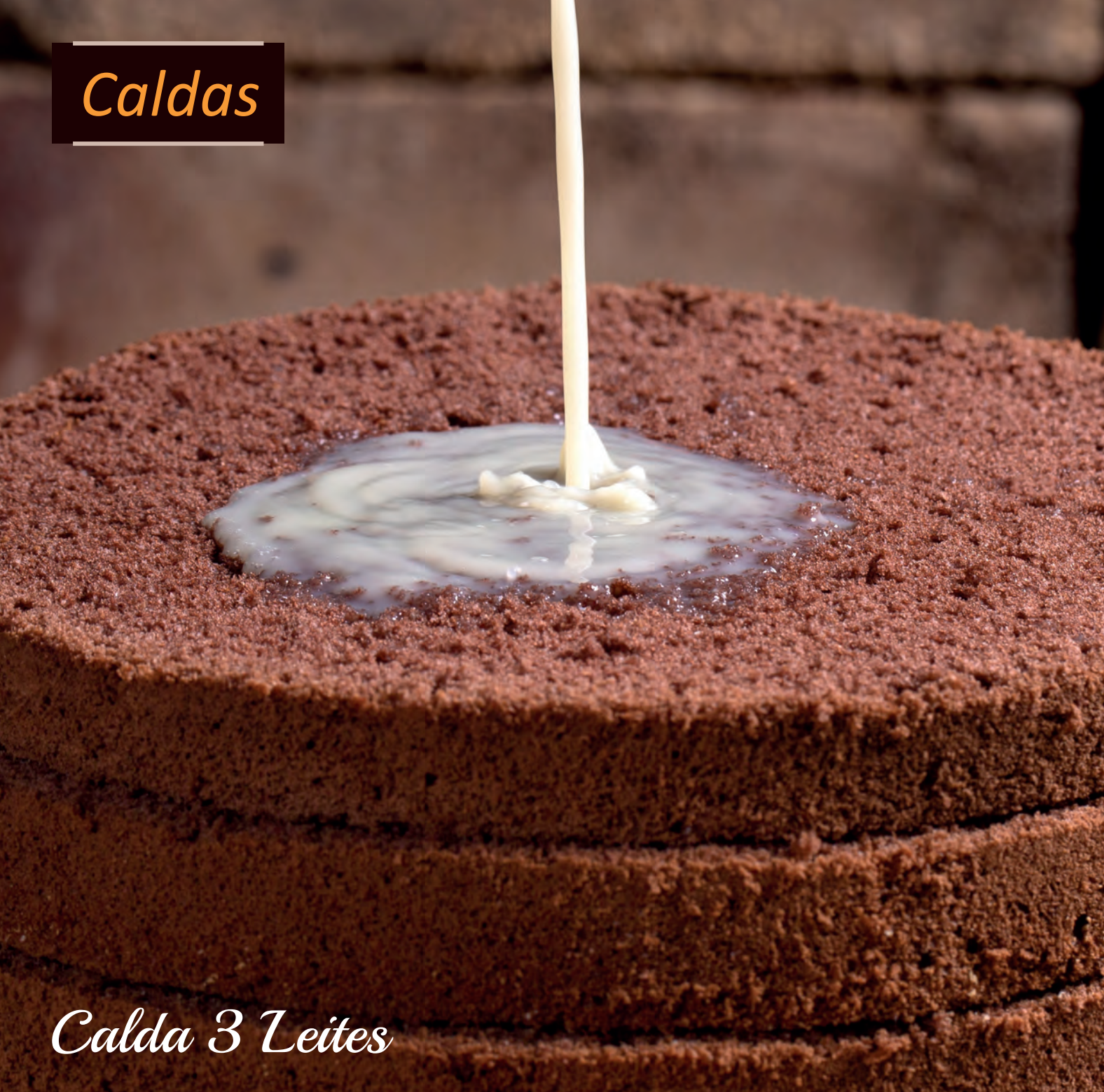
Calda 3 Leites