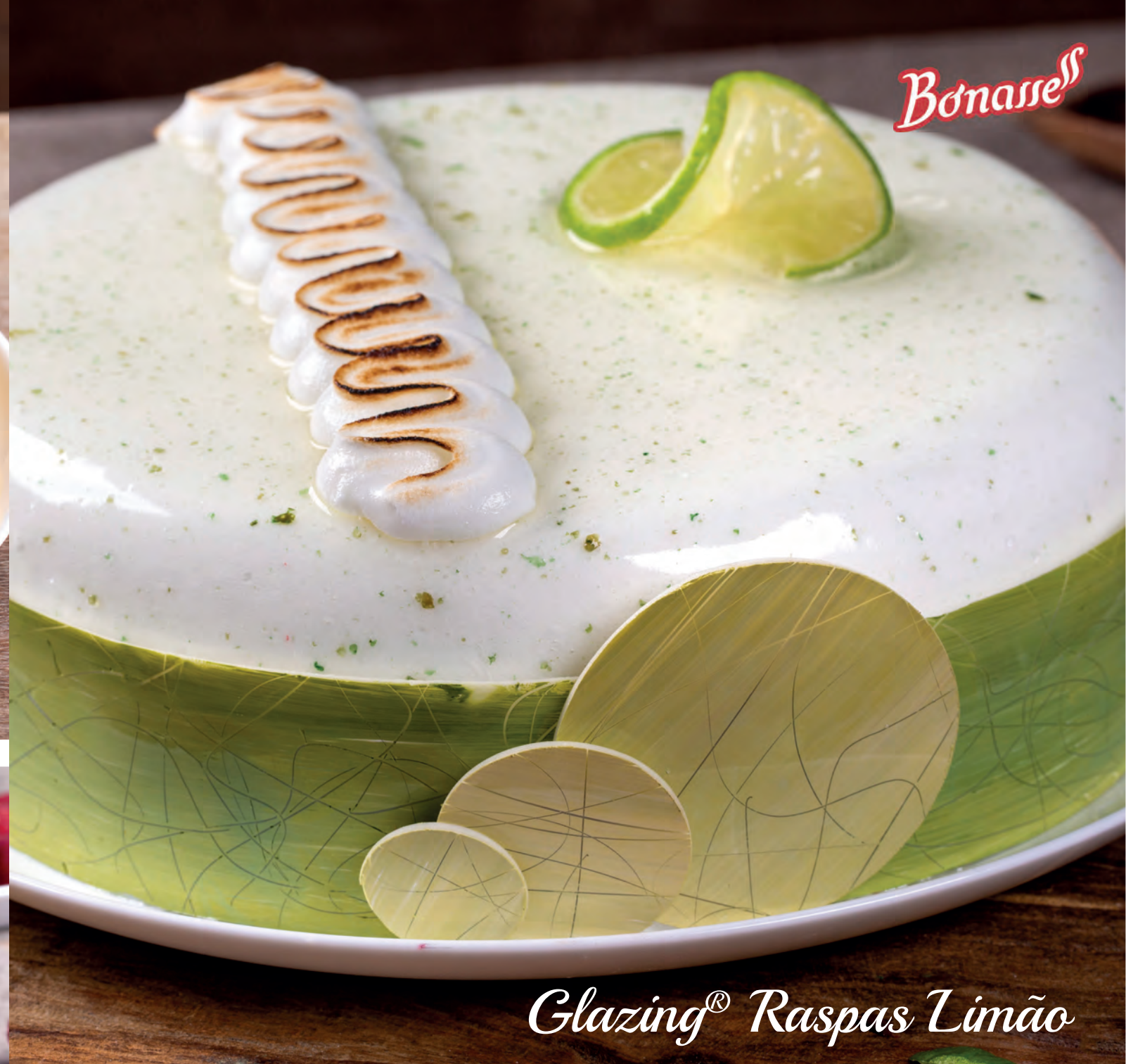
Glazing® Raspas Limão