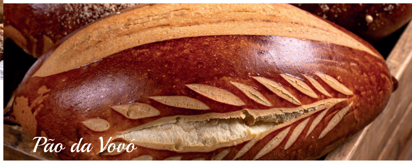
Pão da Vovó