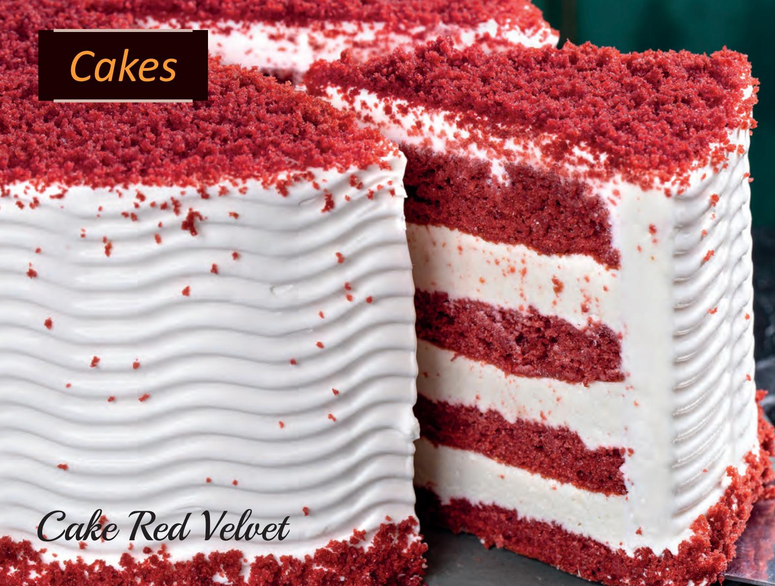
Cake Red Velvet