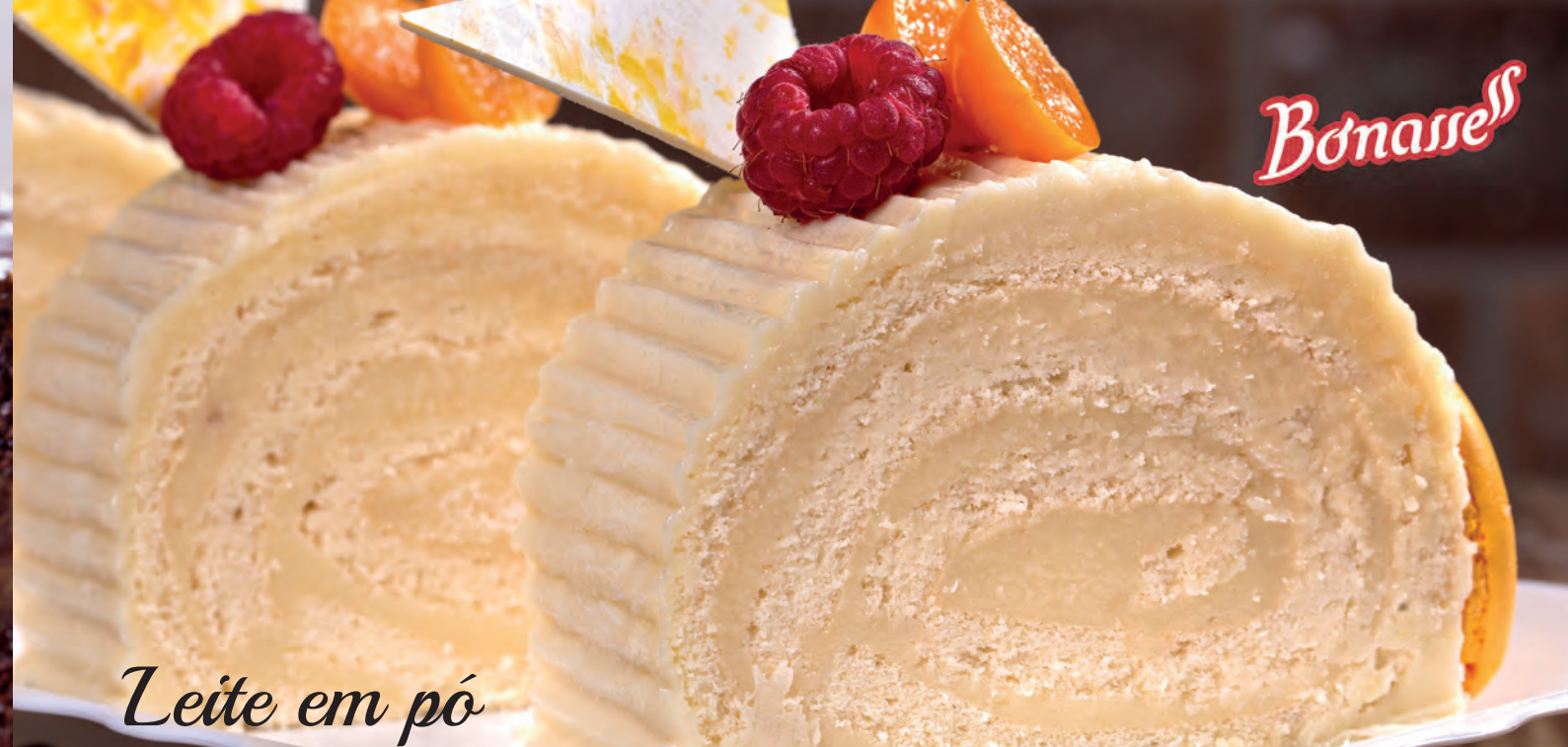
Leite em pó

Os Recheios Bonasse são práticos e versáteis com consistência e sabores ideais para rechear variados tipos de doces e pães.