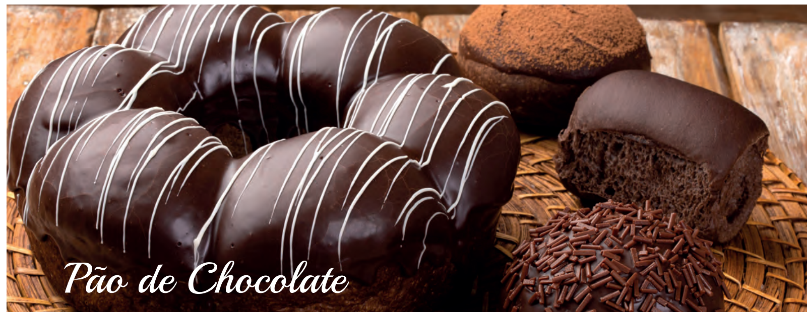
Pão de Chocolate