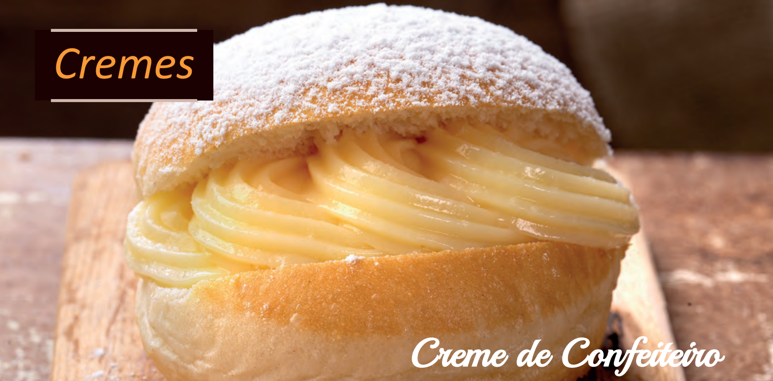
Creme de Confeiteiro