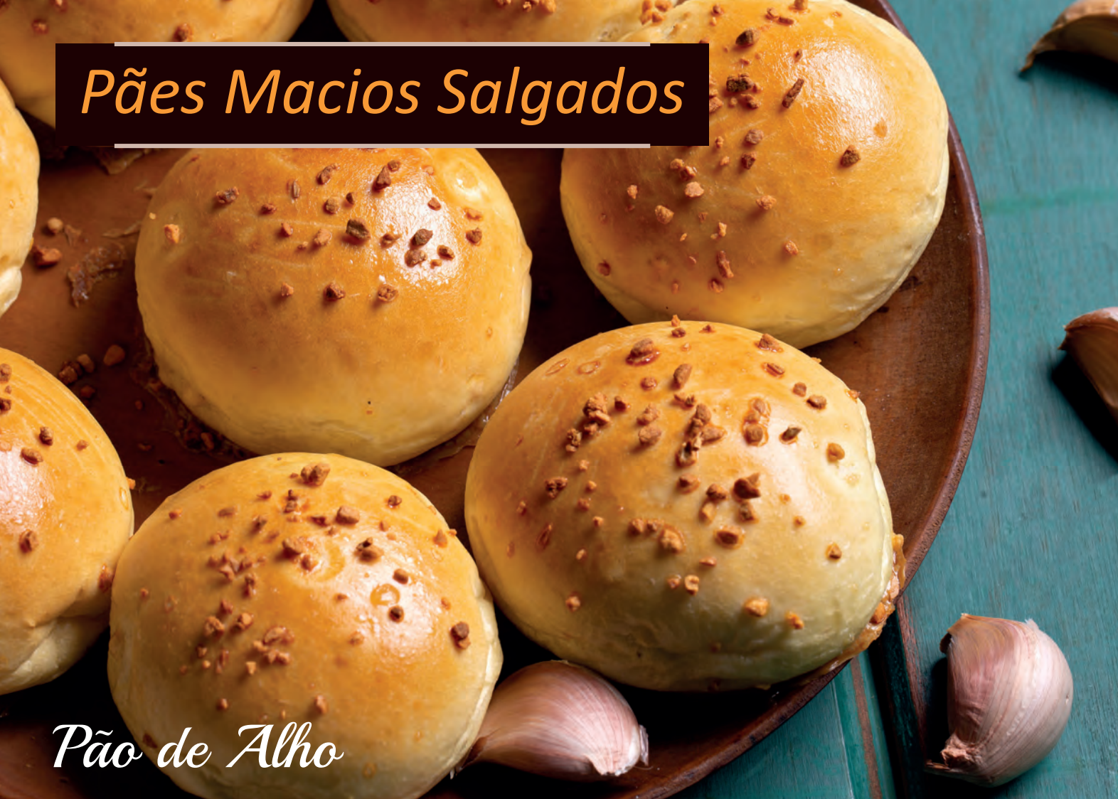
Pão de Alho