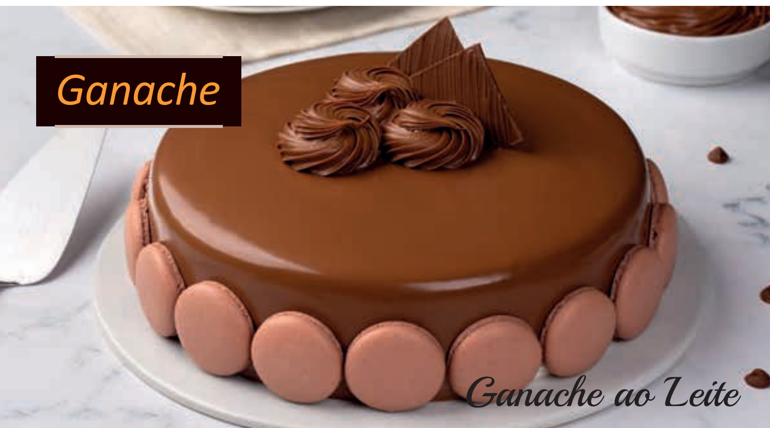
Ganache ao Leite