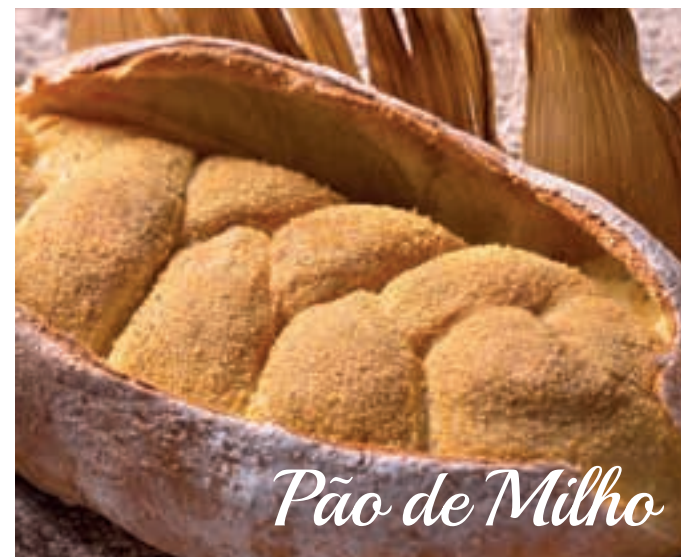
Pão de Milho