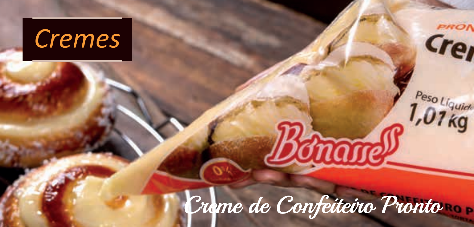
Creme de Confeiteiro Pronto