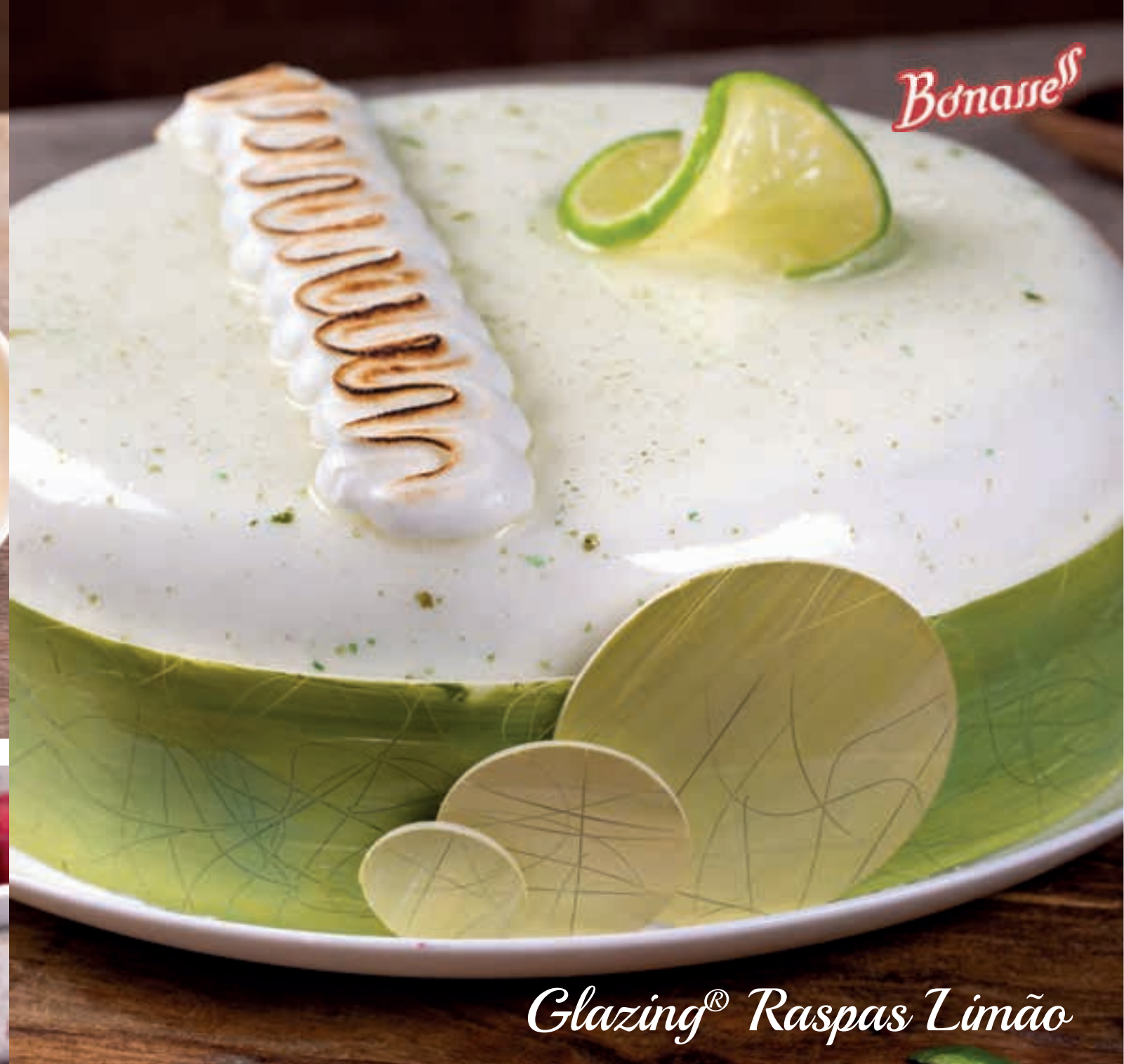
Glazing® Raspas Limão