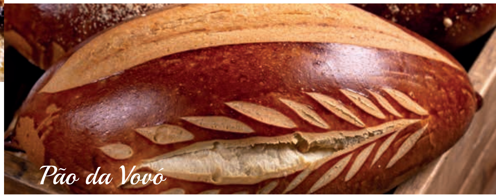
Pão da Vovó