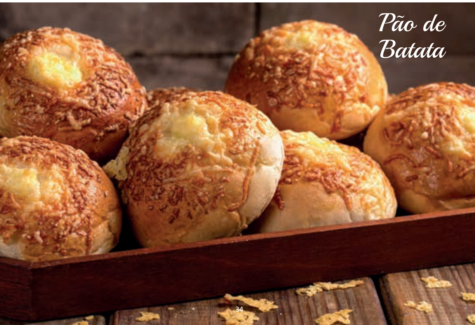
Pão de Batata