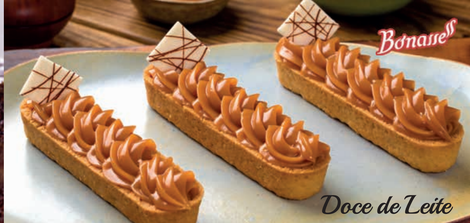
Doce de Leite

Os Recheios Bonassee são práticos e versáteis com consistência e sabores ideais para rechear variados tipos de doces e pães.