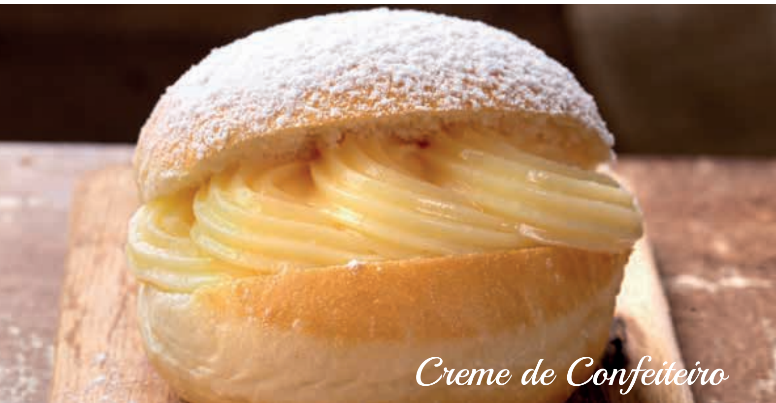
Creme de Confeiteiro