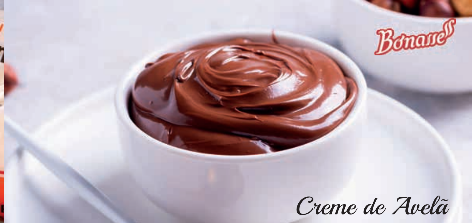
Creme de Avelã